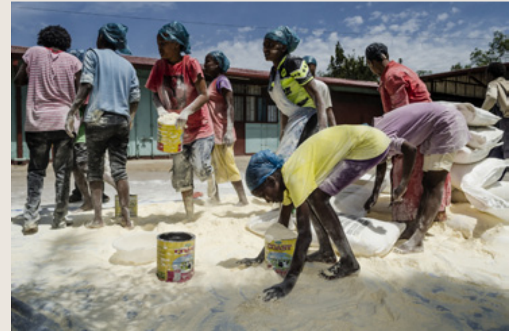
Lem Lem. Yago Ruiz. 40 x 26 cm