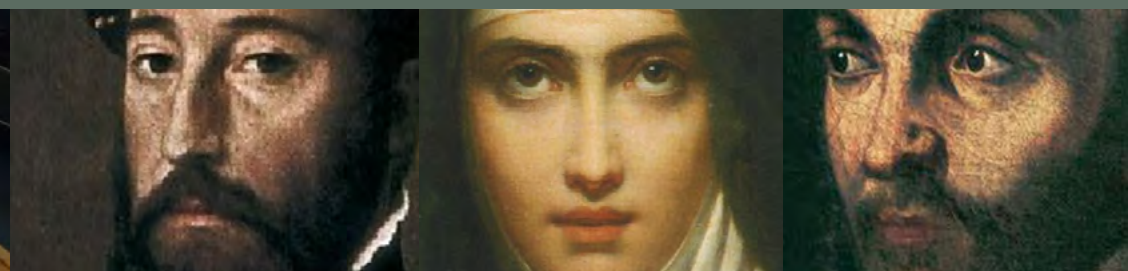
GARCILASO DE LA VEGA Églogas I yII Sonetos