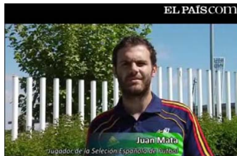
Juan Mata, jugador del Chelsea y de la selección española de fútbol

http://www.elpais.com/videos/sociedad/elegir/equipo/goleador/elpepusoc/20110915elpepusoc_1/Ves/