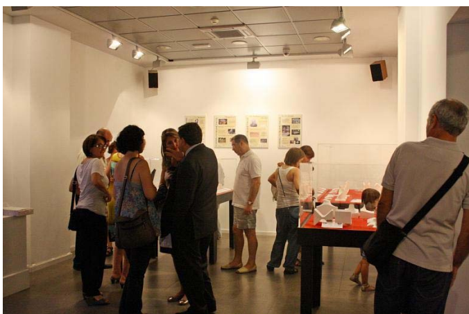
Visita a la colección de esculturas en la inauguración