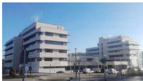
Centro de Física Teórica y Matemáticas