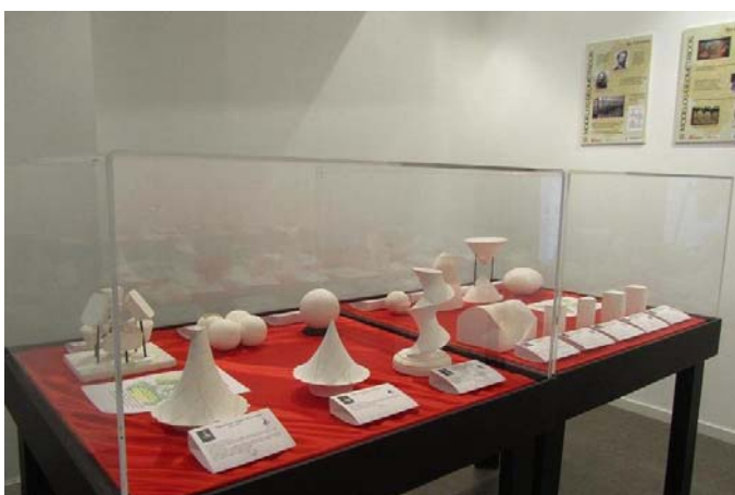
Vitrina con esculturas geométricas de la colección